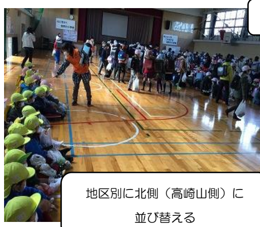
地区別に北側(高崎山側)に 並び替える