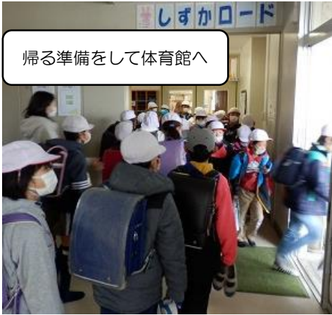
帰る準備をして体育館へ