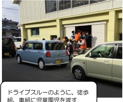
ドライブスルーのように、徒歩 組、車組に児童園児を渡す