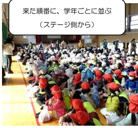
来た順番に、学年ごとに並ぶ (ステージ側から)