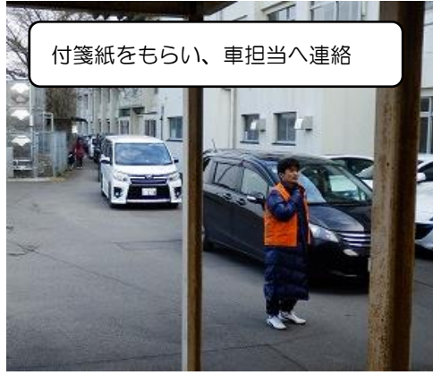
付箋紙をもらい、車担当へ連絡