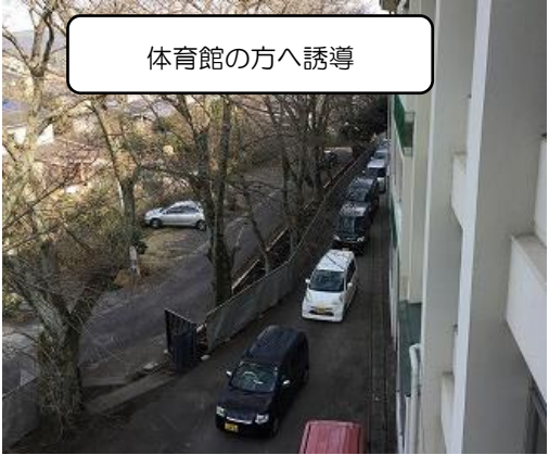
体育館の方へ誘導