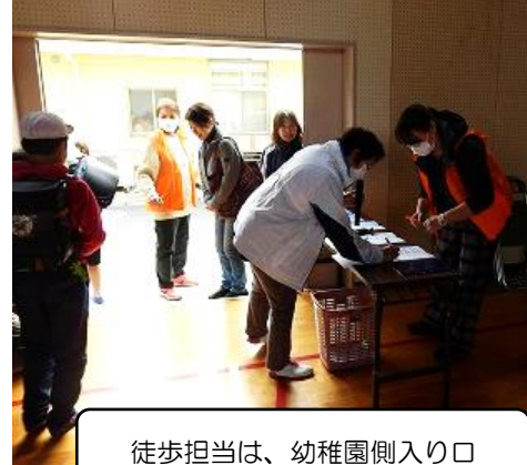
徒歩担当は、幼稚園側入り口