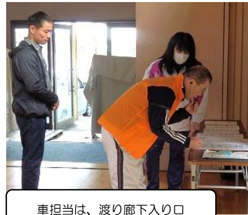
車担当は、渡り廊下入り口