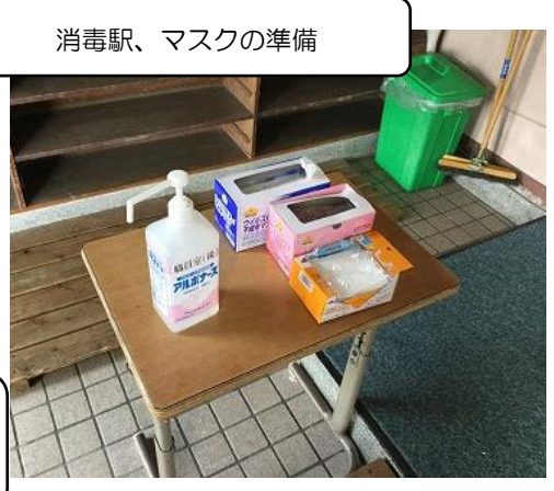
消毒駅、マスクの準備