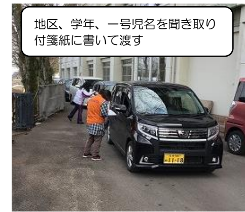
地区、学年、一号児名を聞き取り 付箋紙に書いて渡す