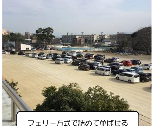
フェリー方式で詰めて並ばせる