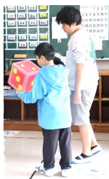
【さいころに願いをこめて】