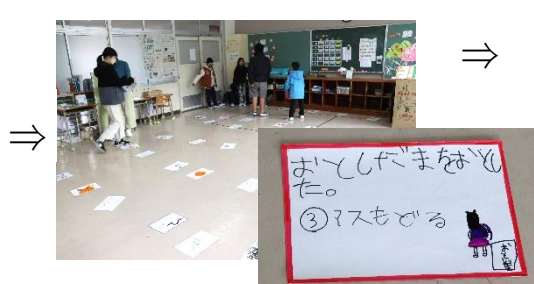
【カードをならべて】