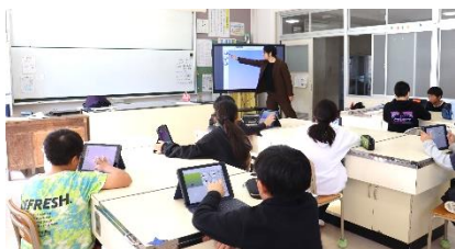
ICT 支援の先生といっしょにプログラミング学習

も果たします。書画カメラもついているので、プリントや教科書を写したりすることもできますし、画面上ではありますが、写したプリントに答えを書いたり丸つけをしたりもできます。導入されて3か月ほどが経ちましたが、すべての学級でたいへん有効に活用しています。