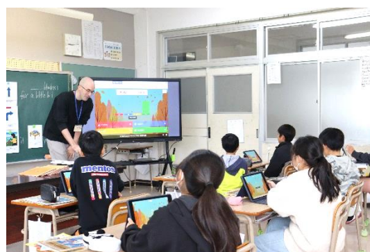
外国語活動でも活躍