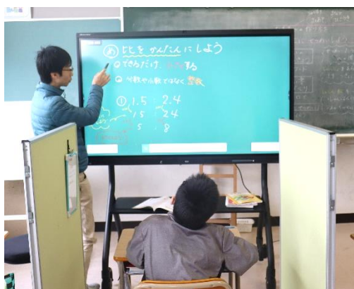
個別指導にも力を発揮