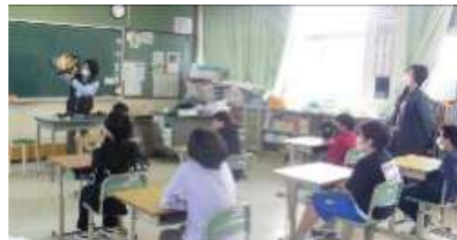
おはなしポケット