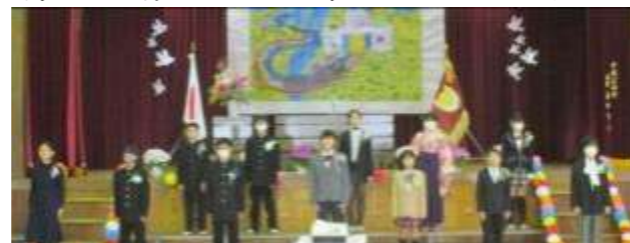
卒業生 別れの言葉