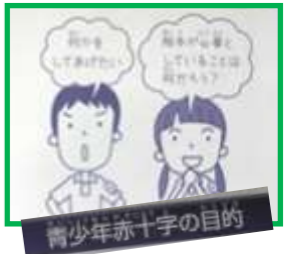
青少年赤十字の目的

今回のような、困りに気づ き、考え、思いやる行動、優し い行動を、どんどん広めてほ しいです。