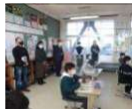
委員さんの授業参観