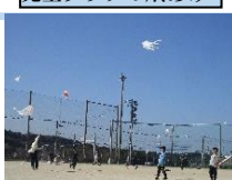
児童クラブの嵐あげ