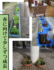
春に向けて少しずつ成長