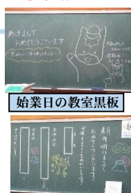
始業日の教室黒板