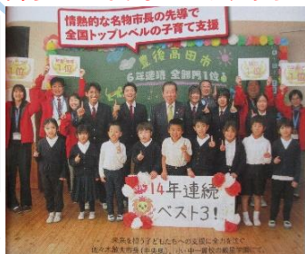
各種コンクール入賞の表彰式