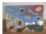
力作がそろった夏休みの工作