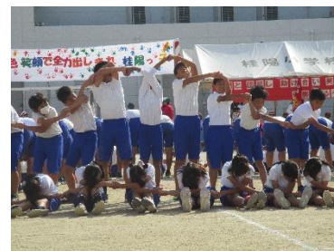
【全校でつながる大運動会】

授業や集会で話をよく聞く 遊び時間のつながり 学校行事・児童会活動 進んであいさつ・言葉遣い