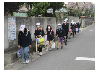
【登校班で並んで登校】