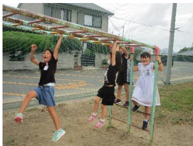
【休み時間は運動場で元気いっぱい】