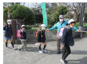
【地域の方が見守ってくれる登校】