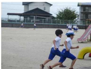
【チャイムの合図を守る児童】