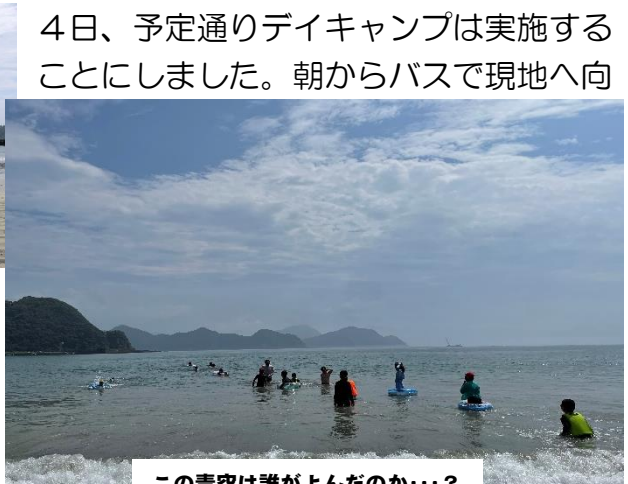
この青空は誰がよんだのか・・・？

かいましたが、予想通り天気は悪く、少しパラつく場面もありました。ところが高速道路で進む中、蒲江の海岸線が見えてくると空が一気に明るくなってくるとは思いませんでした！現地について子どもたちが活動を始める頃には青空が見え、とても良い天気の中