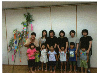
たんぼぼぐみさんの七夕飾り

願いが叶いますように・・・今回の保育参加では、親子で七夕飾りを作っていただきました。さくら組では、織り姫・彦星の髪型を切るのをお母さん達に任せられ悪戦苦闘する姿が。たんぼぼ組では、丸く描かれた顔を形をはさみで切る我が子を横でハラハラしながら見守り、口と手が出そうになるのをグッと我慢しているお母さん達の姿が、とても微笑ましかったですよ。