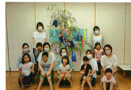
さくら組さんの七夕飾り