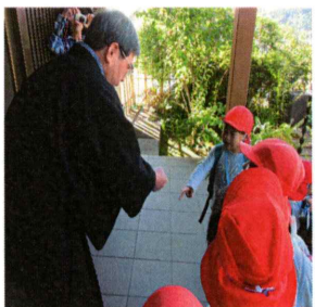
足湯にもはいったよ！！