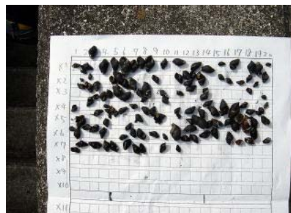
山国川支流にいるカワニナの数