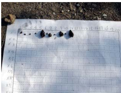
山国川にいるカワニナの数