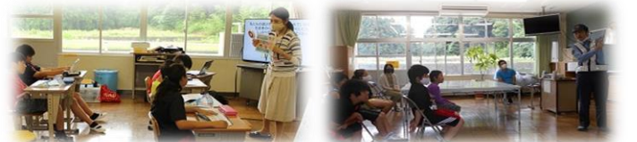
SDGs（地球環境に関する学習）や不審者対応避難訓練