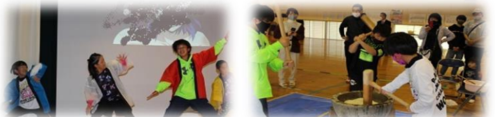
深水まつり～学習発表・参加者全員で餅つき～