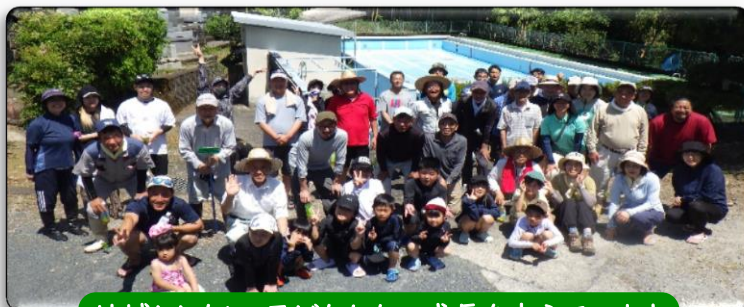
地域とともに、子どもたちの成長を支えています

5月31日(日)にプール掃除を実施しました。当日は保護者や学校運営協議会委員、地域の皆様、消防団、三光支所職員、卒業生など、55名もの方々にご協力いただきました。また、作業後には12名の方々が食事支援をしてくださり、参加者を温かくもてなしてくださいました。子どもたちだけでは難しい作業も、地域の皆様のお力添えにより、安全で美しいプールへと生まれ変わりました。改めて、深水小学校は地域の皆様に支えられていることを実感する一日となりました。心より感謝申し上げます。