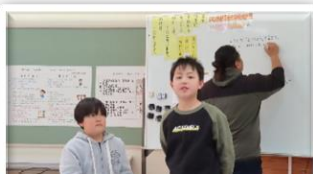
自信を持って発表