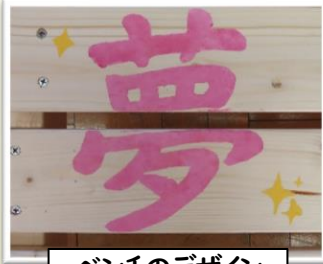
ベンチのデザイン

来年度も、地域とともにある学校として、子どもたちの可能性を大切に育んでまいります。引き続き、深水小学校への温かいご支援をどうぞよろしくお願いいたします。