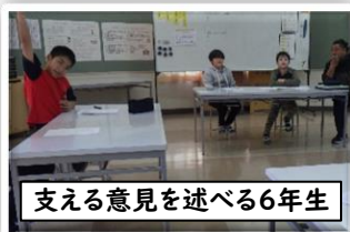
支える意見を述べる6年生