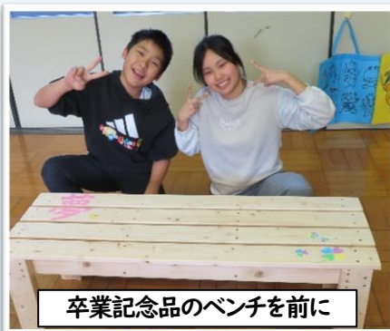
卒業記念品のベンチを前に

卒業生が心を込めて取り組んだ卒業記念品が、いよいよ完成に近づいています。今年度はベンチを製作し、「夢」の文字と工夫を凝らしたデザインを施してくれました。座る人の心が少し明るくなるような、温かい作品となっています。また、学校の顔ともいえる校名看板も丁寧に塗り直してくれました。卒業生の思いが形となり、これからも深水小学校に残り続けます。ベンチは大切に使用させていただきます。ありがとうございます!