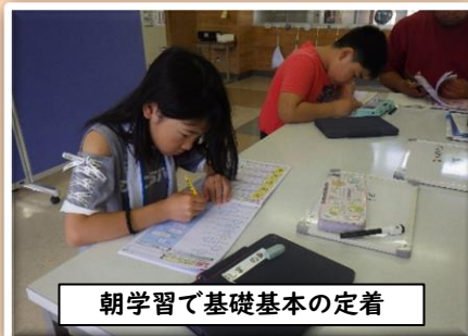
朝学習で基礎基本の定着