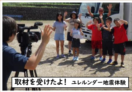
取材を受けたよ! ユレルンダー地震体験