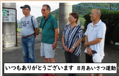
いつもありがとうございます 8月あいさつ運動