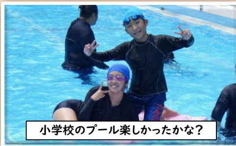
小学校のプール楽しかったかな?