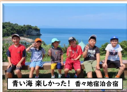
青い海 楽しかった! 香々地宿泊合宿