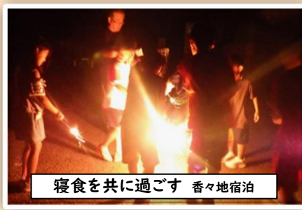
寝食を共に過ごす 香々地宿泊