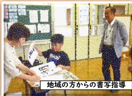
地域の方からの書写指導