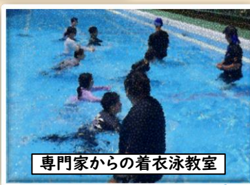
専門家からの着衣泳教室