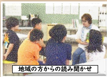
地域の方からの読み聞かせ