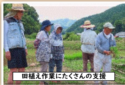
田植え作業にたくさんの支援