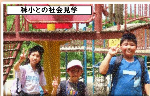
秣小との社会見学