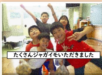
たくさんジャガイモいただきました