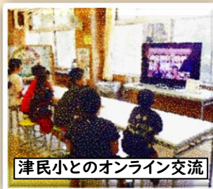
津民小とのオンライン交流