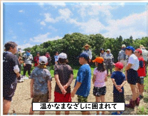
温かなまなざしに囲まれて