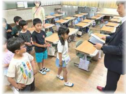
クロームブックが一人ひとりに手渡されました