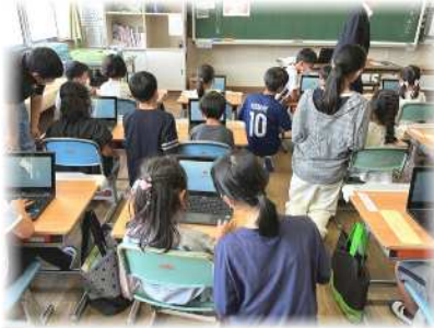
6年生がサポートしてくれました

5月18日には、沖縄県金武町の小・中学校の校長先生方が、本校のギガスクールの取り組みの視察に来られました。「学年に応じた活用が見られ、とても参考になりました」というお褒めの言葉をいただきました。今後も、クロームブックを効果的に活用した授業を通して、主体的、対話的で深い学びを実現していきます。