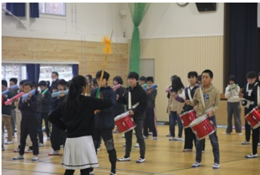
旧鼓笛隊による堂々の演奏

全面改修した体育館は、内装・外装ともに見違えるようにきれいになりました。昭和52年に落成してから47年が経過し、老朽化が進んでおりました。そこで、昨年7月より全面改修工事が始まり、関係者のご努力により1月中旬には完成し、1月20日に引き渡していただきました。今回の工事では、断熱効果の高い塗料が使われたり、床もクッション性のあるものに変わったり、サッシやカーテンもすべて新しくなりました。また、