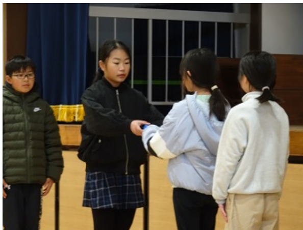
あいさつ運動たすきの引き継ぎ

児童会活動は、学校生活をより良いものにするため子どもたち自身による自治的な活動です。学校全体に関する様々な活動を行っています。6年生は、今までリーダーとして全校児童のお手本となって、7つの委員会に分かれて活動してきました。運営委員会では、毎月のめあてを決めたり、全校集会の世話をしたり、「いいね発見カード」に目を通してそのいくつかを金曜日に放送してくれたりしてきました。放送委員会は、毎日、朝・中休み・給食・昼休みの放送に取り組んでくれました。昼の放送では、みんなの誕生日を紹介してくれました。体育委員会は、毎朝一輪車倉庫と体育倉庫を開けたり、帰りには閉めたりしてくれました。体力アップ集会をしたり、グラウンドにラインを引いたりしてくれました。保健給食委員会は、毎日の健康観察や給食の世話をしたり、保健集会や昼の放送で、健康や給食の事について教えてくれました。図書委員会は、毎朝、毎日小学生新聞や朝日こども新聞を図書室に並べたり、中休みや昼休みの図書当番をしてくれ