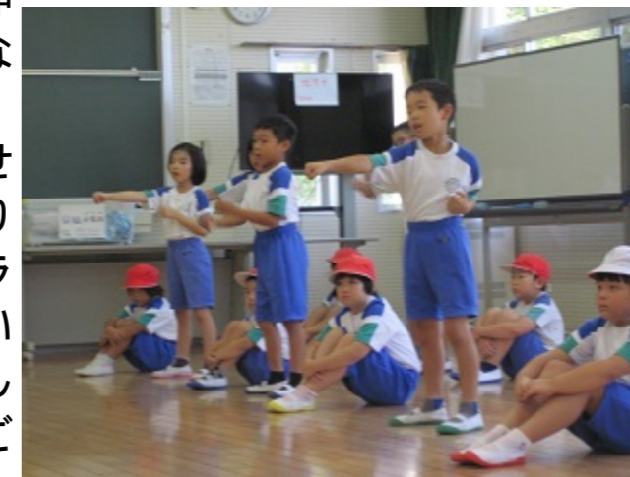
お手本をしてみせる3年生

「伝えること」にがんばった3年生、「学ぶため」にしっかり話を聞いてやってみた1・2年生、この日始まった練習の様子を見て、どこまで伸びるのかとても楽しみになりました。