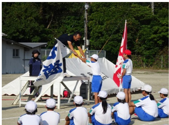
「団旗の伝達」団旗を受け取る団長

スローガンを達成するために、全校のみんなに「頑張してほしい2つの力」について話をしました。一つ目は「力いっぱい最後までがんばってほしい」ということです。勝負ですから、勝ちも負けもありますが、最後まであ