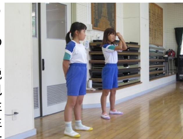
優しく丁寧に説明する3年生

『1・2・3年生のダンス合同練習のようす』 9月6日(金)、低学年のダンス担当の角田先生に「今日から低学年の合同練習が始まるので見に来てもらえませんか。」と誘われたので行ってみました。2時間目が始まったので、多目的室に行ってみると、3年生がお手本を示しながら、並び方や座り方など基本的なことを先生から教わっていました。