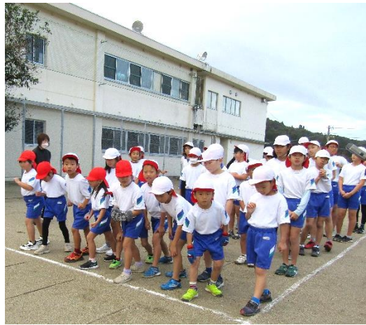
マラソン大会「第1回試走」 =11月27日、小原小学校運動場=

11月27日に、最後のマラソン大会の第1回目「試走」がありました。3回の試走をし、12月12日にマラソン大会本番を迎えます。低学年・中学年・高学年ごとにスタートしました。分かれ道や合流地点に立っている職員に励まされながら、きつくても真剣に走る姿がとてもしっかりいでした。道路からグラウンドに入ると、友だちの声援に押され、さらにスピードが出ていくようでした。事故もなく、第一回目の試走を終えることが出来ました。本番に向けて、2年・4年・6年生は、昨年度の自分の記録を目安に、1年・3年・5年生は、初めての