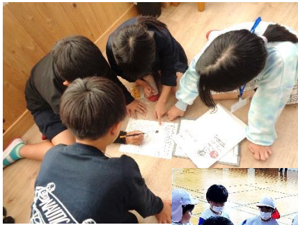
3校の児童が 触れ合える場 面を仕組んで