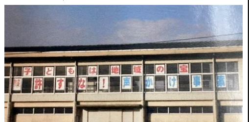
以前の体育館東側の窓の景色

記念誌に載せる写真選びをするなかで、上の写真を見つけました。 子どもは、地域の宝 許すな!声かけ事業 地域の方々の力をお借りしながら、子どもたちの登下校を見守っていただいたことと思います。 保護者会でも、立て看板を作成して防犯に務めていただいたようです。本当に地域に守られています。