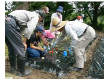
野菜作り体験活動 (5~11月)