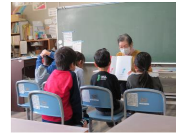
読み聞かせ (毎月第1・3金曜日)