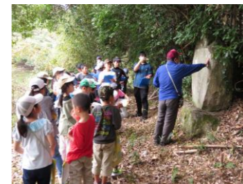
地域(ため池)学習 (11月)