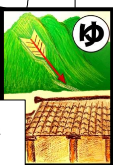
弓矢がね 阿蘇から届いた ほこ神社