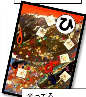
光ってる 夕日がうつる 野上川