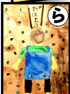
ランドセル かるってあいさつ 大声で