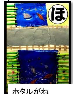
ホテルがね かがやく地区は 野上地区