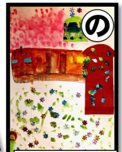
野上小 裏を走るよ 豪華列車