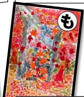
もみじがね 秋にはきれい 通学路