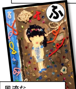
風流な 風のひびきが すずしいな