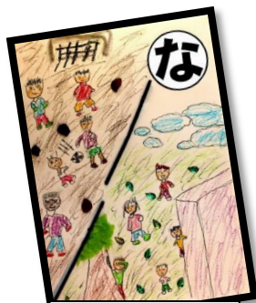
なかよしだ 野上の子ども 輪になって