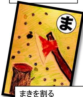
まきを割る 音が響くよ 尾本原(ばる)