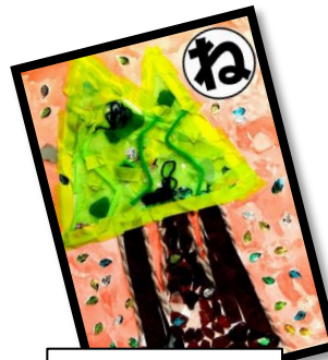
願い事 三本杉の ほこ神社