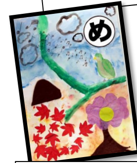
めじろどり かわいい鳴き声 聞きたいな