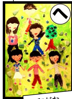
平和だな 笑顔がじまん 野上小