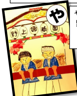
やまひいて 野上を駆ける 若衆たち