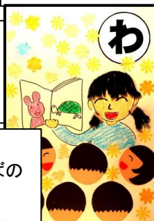
輪になって おはなしひろばの はなし聞く