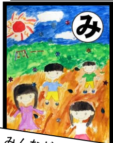
みんながね とてもなかよいの がみっ子