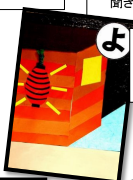
夜になり 灯りのともる はしんねけ