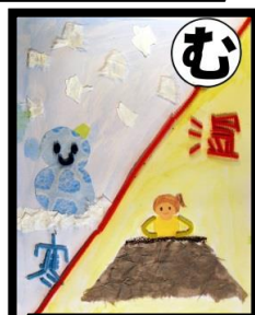
無理なんだ 寒い気温 のりきるの