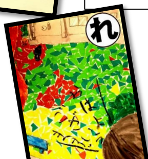
礼をして 元気にあいさつ 野上っ子