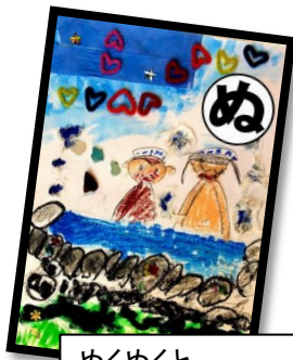
ぬくぬくと みんなで入ろう 温泉に