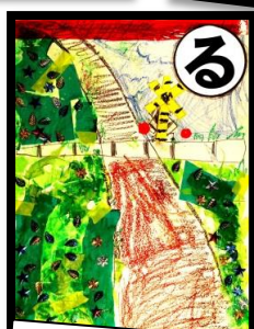
るりいろの 空までつづく 尾本坂