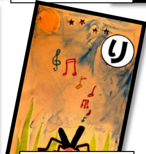
リンリンと うたうズムシ 秋の夜