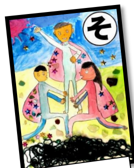
そ ソーランぶし 個性あふれる おどりだよ