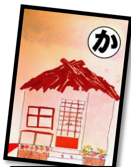
か かやぶきの 中村駅は きれいだな