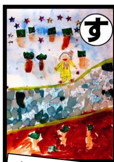
す すきとおる 中栗川には 魚がいっぱい