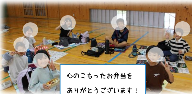
心のコモったお弁当を ありがとうございます！

5/8【体力アップタイム】今回は大股開き・腕立てに取り組みました。班で工夫を凝らしながら何回も挑戦していました。