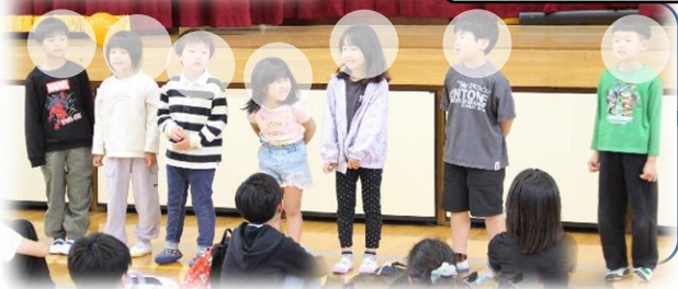
↓ピカピカの1年生たち

あいにくの天気でしたが、企画進行を務めた運営委員の皆さんのおかげで、楽しい時間を過ごすことができました。