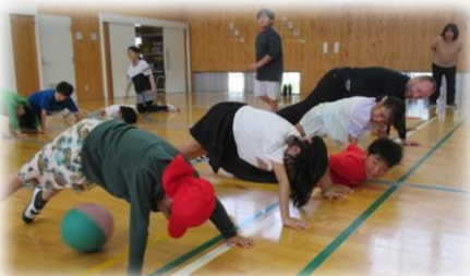
《うまくボールが転がるようにしっかり腕を立てて！》

5/8【体力アップタイム】今回は大股開き・腕立てに取り組みました。班で工夫を凝らしながら何回も挑戦していました。