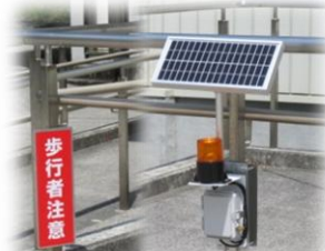
《人が通ると点滅します。》

大分市の(株)江藤酸素様が県内の学校に設置して下さいました。子どもたちが安全に通行するために役立っています。