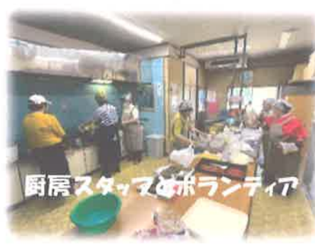
厨房スタッフとボランティア

スタッフとボランティアも自慢の腕を奮って美味しいカレーとスパゲッティサラダを作りました。参加者から「美味しかったまた来るね」と笑顔で声を掛けられ、子どもだけでなく、地域の高齢者や保護者など利用が増え、地域の交流の場として、人が集まる場所があることで住民のコミュニケーションの場ともなっています。