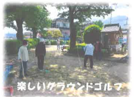
楽しいグラウンドゴルフ

皆さんから、「今から体操が終わったらグラウンドゴルフしたいという声が上がりました。