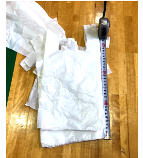
どこにでもあるレジ袋