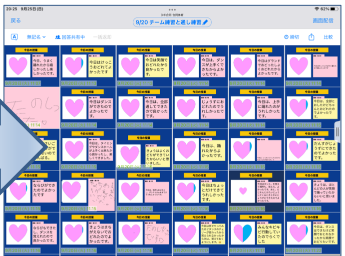
各チーム，実行委員も共有している授業の振り返り。協働的にお互いの困りに寄り添っていく中で，肯定的な授業評価（ピンク色）も増えてきました。