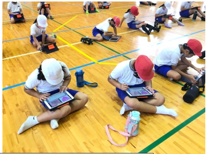
ポイントとなる場所は指導をしたり、相談に乗ったりしています。