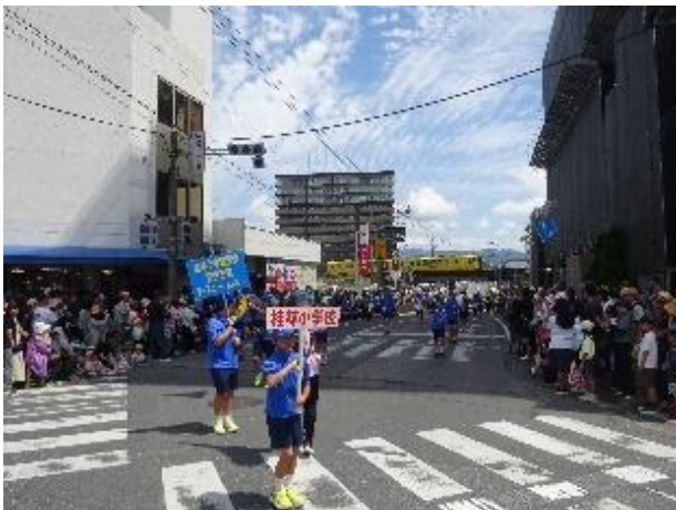
音楽大パレードでは、想像以上の人垣に緊張しましたね。仲間とがんばり、桂林小鼓笛隊のこよさを見せることができました。

※桂林小鼓笛隊に対し、あたたかくて優しい、そして、力強いご声援を地域の方々からいただきました。また、五・六年生以外の保護者の皆さまからもたくさんいただきました。ありがとうございます。また、多くの方々からご芳志もいただきました。楽器やユニホームの修理や補充等に大切につかわせていただきます。心から感謝申し上げます。