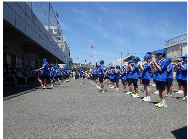
校区パレードでの子どもたち。5年生は初めての経験でした。地域の施設を巡り、あたたかい声援をいただきました。感動を届けられました。