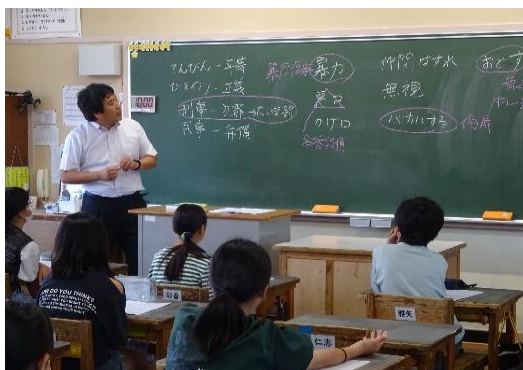
スクールロイヤー…法律の専門家である弁護士。法的側面からのいじめ予防教育や児童・生徒指導に関する学校からの相談対応等の業務にあたっています。