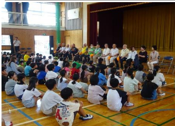
スクールガードの皆さんが現れると、子どもたちも自然と笑顔がこぼれます。

桂林小学校の子どもたちの登下校を見守ってくださっているスクールガードの皆さんに来校していただき、全校児童との対面式を行いました。普段から優しく子どもたちを見守り、言葉かけをしてくださっている皆さんです。式の中でひと言ずつご挨拶をいただきましたが、「皆さんが元氣よく『おはようございます』と言ってくれるから元氣をもらっています。」「これからも交通ルールを守って元氣に登校してください。」など、