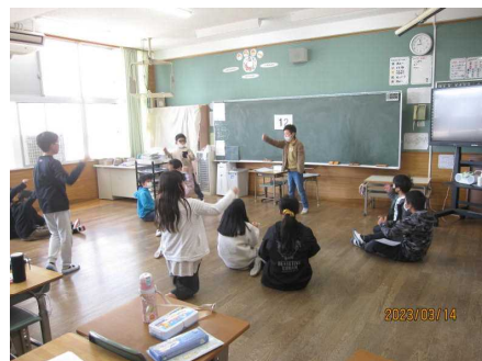
＜6年生を送る会より＞

来年度より、通常の授業・学校生活・行事に戻るよう、保護者の皆様のご理解をいただきながら、工夫して取り組んでいきたいと考えています。また、保護者アンケート結果等を参考にし、職員で児童の実態や課題を出し合いながら今年度の反省を進めているところです。来年度に生かしていきたいと思えます。