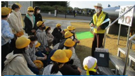
「回天」公園で語り部の方のお話

残念ながら今年も県内日帰りとなりましたが、朝の7時から夕方6時過ぎまで、いつもより長い1日を仲間と共に過ごしました。平和学習、地獄めぐり観光、城島高原パーク。思い出に残る修学旅行となりました。