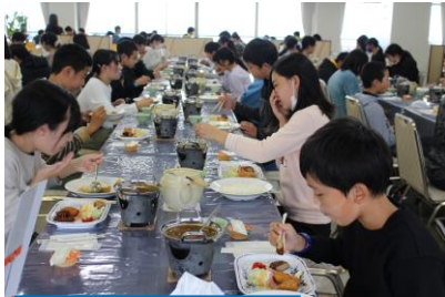
屋食はカレーランチ