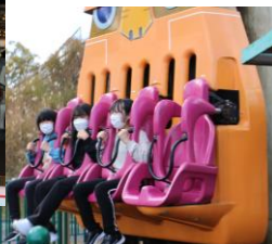
城島高原パーク 時間いっぱい楽しみました