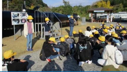
「回天」の前で3校合同平和の集い