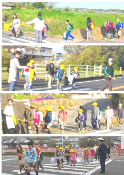
毎朝の登校の様子

「おはよう!」「おはようございます!」…と、毎日元気なあいさつで、1日がスタートしています。どのクラスからも、子どもたちの元気な声が聞こえてきます。先生方と子どもたちが心を一つに、しっかりスクラムを組み、1時間1時間を大事にしながら学習や活動をしている様子が、よく伝わってきます!