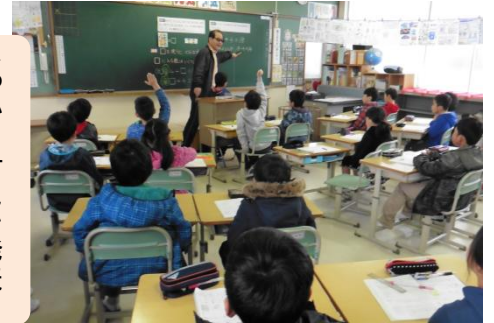
しっかりと考えを発表