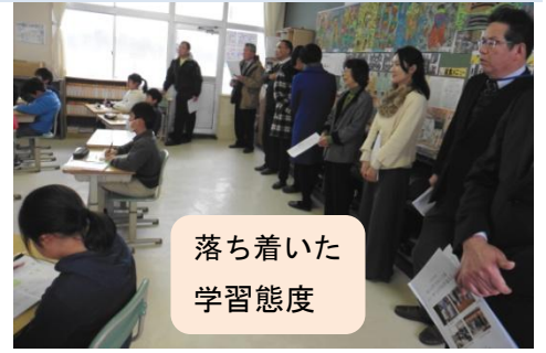
落ち着いた 学習態度

2月9日(木)、宇佐市教育委員会の時枝先生、宇佐中学校教頭先生、学校評議員さん、PTA会長・副会長さんの参加のもと、各教室の授業の様子を見た後、宇佐っ子の学力、体力について調査結果を基に話し合いをしました。12月の校内の学力テストでは、全学年が全国平均を上回りました。5年の体力テストでは握力、長座体前屈、シャトルランがもう少しです。しかし「運動が好き」「体育の授業が楽しい」と回答した子は100%でした。2月27日～3月10日は本校の学力定着旬間です。3学期の学習が定着するように、しっかりと指導します。