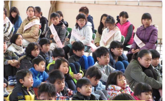
しっかり演説をきいています

さて、1月19日に29年度の前期児童会役員選挙投票集会が行われました。次年度の宇佐小学校を引っ張っていく児童会立候補者・応援者の力強い演説が行われました。全校児童が一人一人の話を真剣に聞き、誰に投票するか決めていました。2月3日、なかよし集会の中で旧メンバーから新メンバーへ「ノート」の引き継ぎが行われ、新メンバーでの活動がスタートしました。