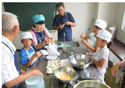
3年 やせうまづくり (宇佐公民館)