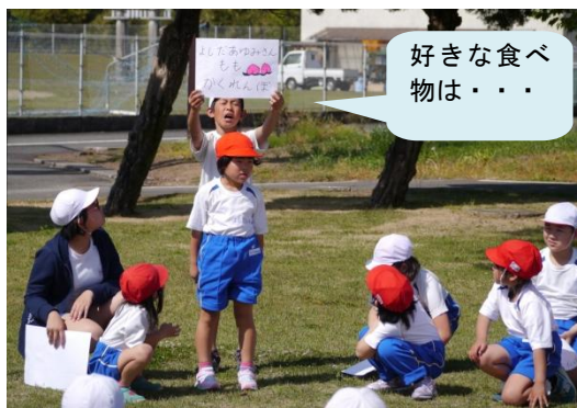
好きな食べ物は・・・