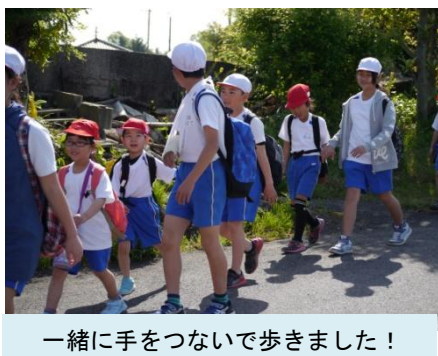
一緒に手をつないで歩きました！