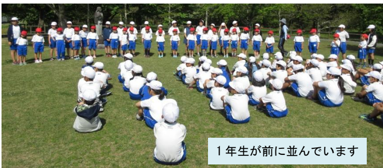
1年生が前に並んでいます

4月20日(金)はお迎え遠足でした。総合運動場まで1年生は5・6年生と手をつないで歩きました。とても良いお天気で、カー杯遊んで、しっかり日焼け？した1日となりました。4月の児童会のめあては、「1年生の名前を覚えて仲よくなろう！」でしたが、23人の名前と顔を覚えるのは、なかなか大変だったようです。全員を覚えるのには、もう少し時間がかかりそうです。