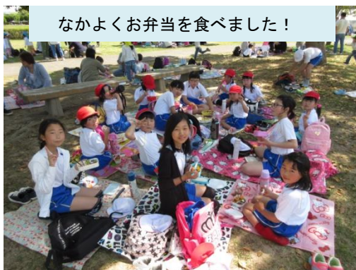
なかよくお弁当を食べました！