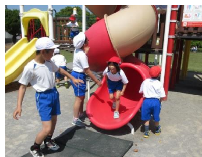
一緒に遊んでくれました！