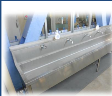
北校舎手洗い場・ トイレ洋式化完成

3月から工事をしていましたが、トイレの洋式化、北校舎手洗い場新設の工事が終了しました。今年度、4月から気持ちよく使えるようになりました。うれしいです。校舎は古い宇佐小学校ですが、大切に使いながら、設備の改善が進み、学校環境が整備されていってほしいです。