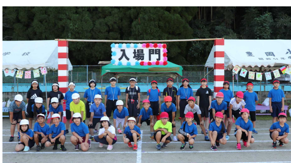
【運動会がんばるぞ～！、ハイ・チーズ】