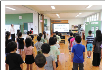
【みんなで校歌斉唱】

で、「ねばり強く」「協力し」「頑張る」心が育ち、子どもたちが成長するのに絶好の機会となります。