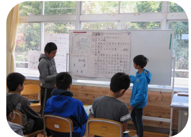
【6年・ポスターセッションによる発表】