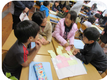
【3年・ふせんを使った話し合い】

取組みに協力いただいた多くの皆さん、参観いただいた保護者の皆さん、ありがとうございました。