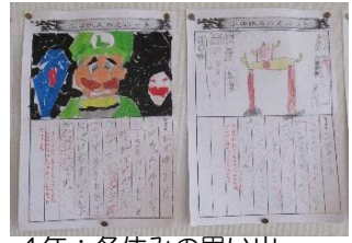
4年：冬休みの思い出