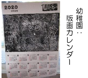
幼稚園... 版画カレンダー

佐伯鶴城高校から、発表会の案内が届きました 〇スーパーサイエンスハイスクール成果発表会