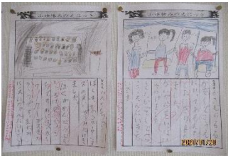
1年：心ゆやすみのおもいで

作品を見ると、冬休みの楽しい思い出が絵と文章から伝わってきたり、俳句を読んでクスッと笑わされたり、文章からこんなことを考えているのかと感心させられたりと温かい気持ちになります。子どもの作品は素敵だなと思います。