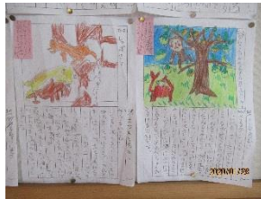
2年：お話びじゅつかん