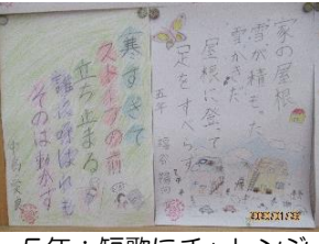
5年：短歌にチャレンジ