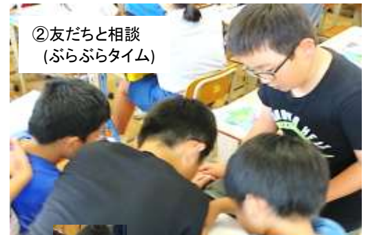
②友だちと相談 (ぶらぶらタイム)

10月～11月は授業改善に向けた校内授業研修を重点的に進めています。各教員が授業をお互いに見合い助言をもらいながら、子どもが話し合いをしながら主体的に学べる「わかる・できる」授業をめざしています。学力向上に向けた重点取組を達成できるように、日々授業に工夫を加えています。