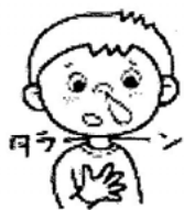
鼻水・鼻づまり 頭がポォーとする