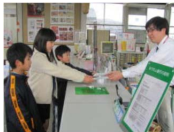
沖代郵便局にて(児童会代表)

児童会では、昨年末よりユニセフ募金の運動を行って来ましたが、先日集まった募金を振り込みました。総額は、 47,268円 でした。ご協力ありがとうございました。