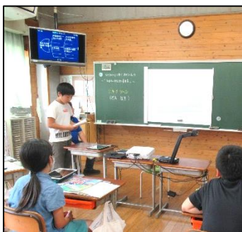
タブレットを活用した6年生の授業風景・図工で立体表現に取り組む4年生）