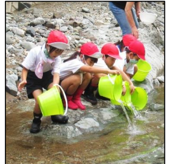
（写真：タブレットを活用して発表する5年生・少人数で教えあう4年生・3年生と1年生の体験学習）