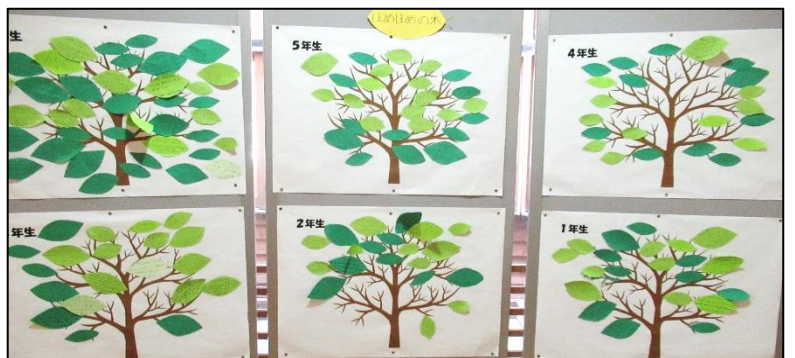
（写真：掲示中の「ほめほめの木」 2学期もみんなのいいところを見つけよう）