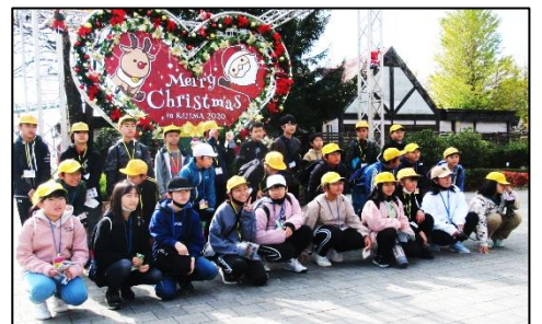
（写真：九重「悠々亭」での食事風景・「城島高原パーク」の様子・下↓三代目エンジェルと記念写真）