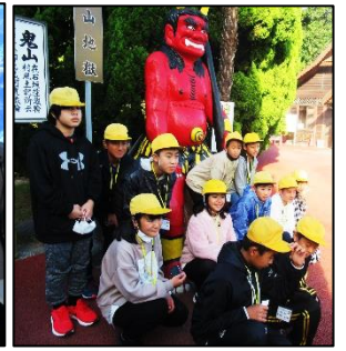
（写真：掩体壕の平和集会・臼杵の石仏の前で集合写真・「うみたまご」と「鬼山地獄」での1場面）