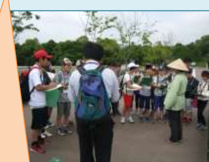
飯田・淮園・南山田小グループ