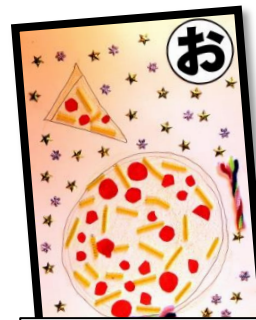
お おいしいな かのんのピザは 野上ー