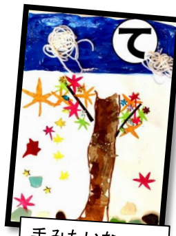
て 手みたいなの きれいなもみじ あるんだよ