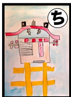
ち 地域でね 楽しいことは 祇園祭