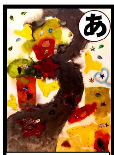
あ 秋だよと 教えてくれる 九酔溪