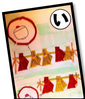
い 稲をかる 野上小の 五年生