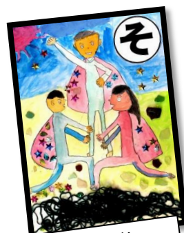
そ ソーランぶし 個性あふれる おどりだよ