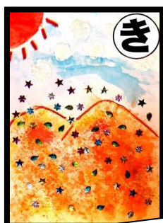
き きれいだね 自然がいっぱい 野上小