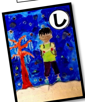
し しんしんと 降る雪とても 冷たいな