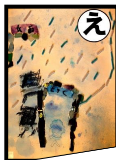
え 遠方から ようこそ九重 インターチェンジ