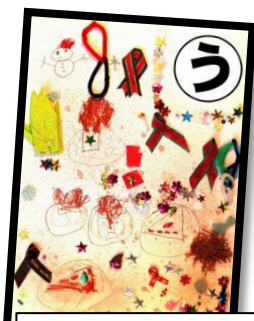
う 梅の家の ケーキは冬しか 売ってない