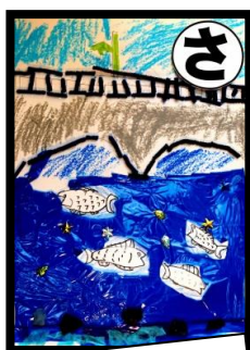
さ 魚いる とてもきれいな 野上川