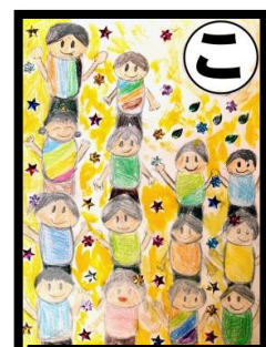
こ こんなにも ともだちできる のがみしよう