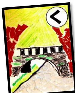
く 車から きれいに見える みょうけん橋