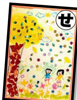
せ せーのでね たくさんひろう 落ち葉だよ