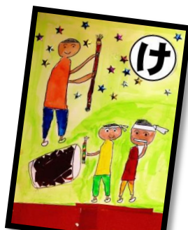
け 軽快な 笛と太鼓の みほこ楽