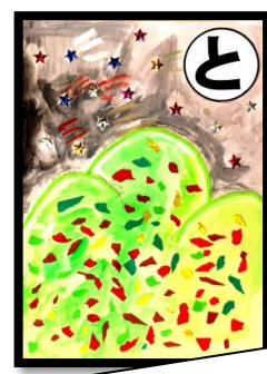
と 遠くから きれいに見える 九重山