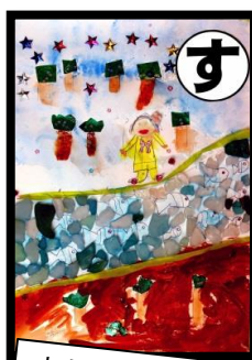
す すきとおる 中栗川には 魚がいっぱい