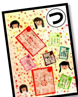
つ 伝えよう 野上のじまんを かるたでね