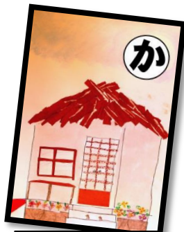
か かやぶきの 中村駅は きれいだな