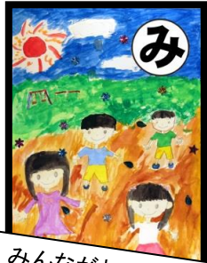
みんながね とてもなかよいの がみっ子