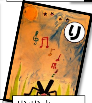
リンリンと うたうズムシ 秋の夜