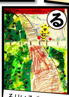
るりいろの 空までつづく 尾本坂