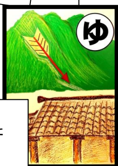
弓矢がね 阿蘇から届いた ほこ神社