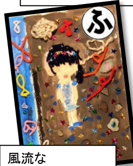
風流な 風のひびきが すずしいな