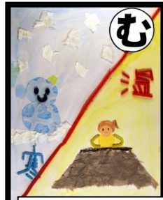
無理なんだ 寒い気温 のりきるの