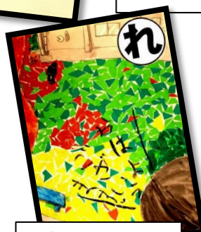
礼をして 元気にあいさつ 野上っ子