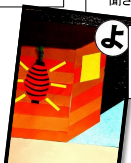
夜になり 灯りのともる はしんねけ