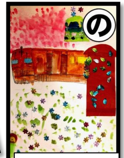
野上小 裏を走るよ 豪華列車