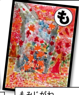
もみじがね 秋にはきれい 通学路