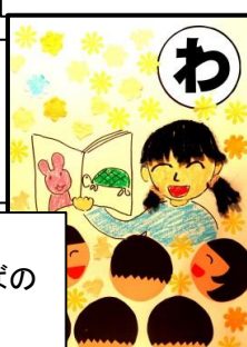
輪になって おはなしひろばの はなし聞く