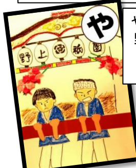
やまひいて 野上を駆ける 若衆たち