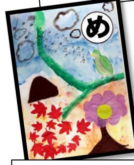
めじろどり かわいい鳴き声 聞きたいな