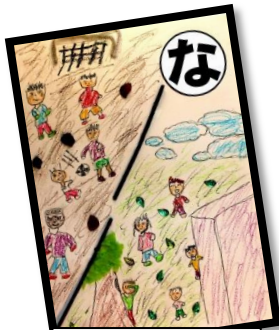
なかよしだ 野上の子ども 輪になって