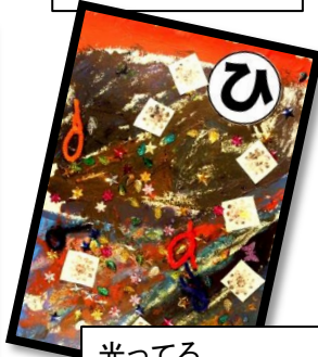
光ってる 夕日がうつる 野上川