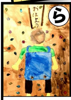
ランドセル かるってあいさつ 大声で