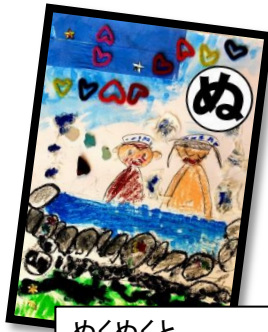
ぬくぬくと みんなで入ろう 温泉に