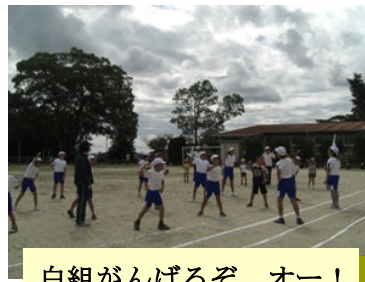
白組がんばるぞ、オー!

九月三十日の運動会に向けて、練習も仕上げに入っています。今日は、小運動会が行われました。一人ひとりに、暑さに負けずに頑張る姿は、たのもし限りです。最近では、「今のは九十九点、いいよ!」等、指導の先生方のほめる言葉がよく聞こえてきます。本番に向けて、順調に仕上がっています。