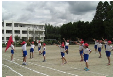
赤組がんばるぞ、オー!