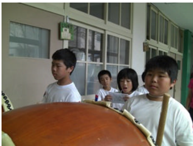
盆踊り 太鼓・くどきの練習

九月三十日の運動会に向けて、練習も仕上げに入っています。今日は、小運動会が行われました。一人ひとりに、暑さに負けずに頑張る姿は、たのもし限りです。最近では、「今のは九十九点、いいよ!」等、指導の先生方のほめる言葉がよく聞こえてきます。本番に向けて、順調に仕上がっています。