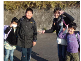
(笑顔がいいですね)