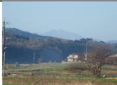
由布山を望む7時30分