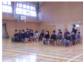
在校生の聞く態度