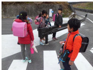
鴨川方面の友だちも来たよ。